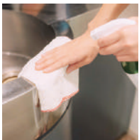
キッチン周りのシンクにも!